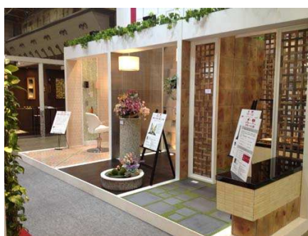
<デザイナーブース>