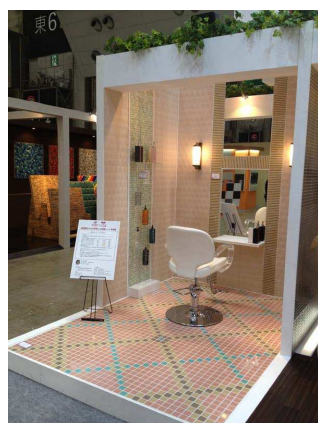
<3/6 関東事業支部 堀 容子さん 作品とトークシーン>