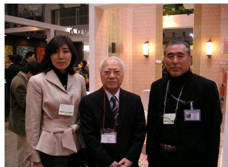
<初日に峰尾事務局長と共に>